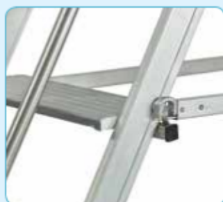
• Dispositivo anti apertura-chiusura